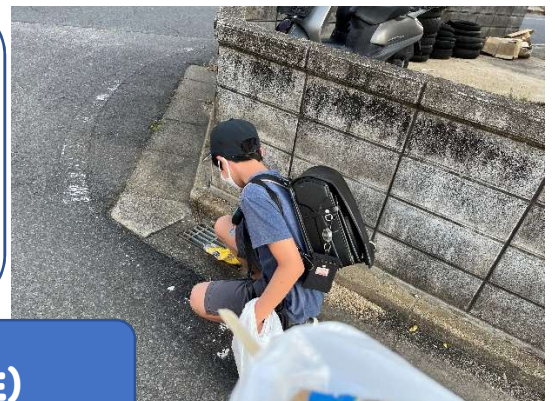
ゴミ拾い活動(6年生)

朝、通学路のゴミを拾いながら登校しました。 昨年度、善行表彰を受けた本校の活動、今年度もみんなで取り組んでいきたいと思っています。