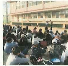
写真左から「語り部の方のお話」「爆心地公園での平和集会」「出島での学習」「帰校式」