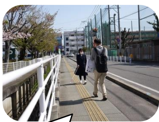
本校校門前にて、白杖歩行の取材の様子。

昨年度末の点字ブロック啓発活動については既報（本校ホームページにサガテレビの動画リンクあり）ですが、4月8日（金）にはNHK佐賀放送局からも取材を受け、高等部の生徒会役員が対応しました。JR佐賀駅では、いまも約15分おきに啓発アナウンス（本校生の声！）が流れています。佐賀駅にお越しの際はどうぞ耳をお澄ませください。