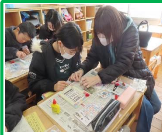
4年生 フォトフレームづくり