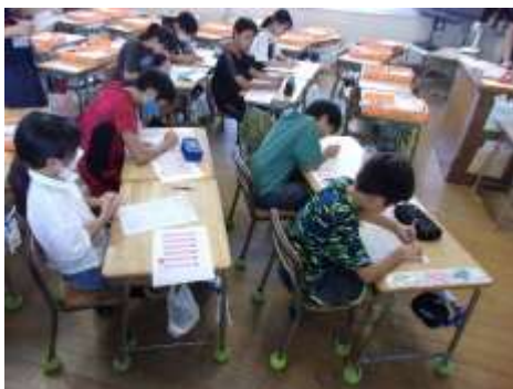
得点記録係：得点の付け方を学んでいます。