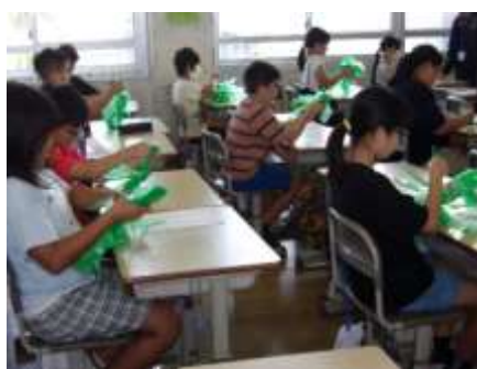
招集・誘導・4年生：道具の準備です。