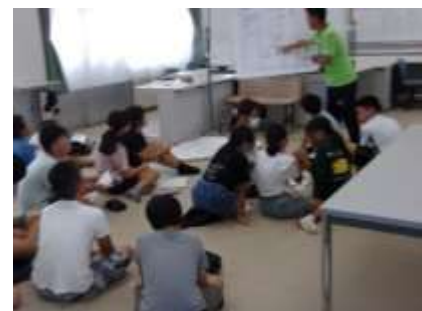
用具係：競技に使用する道具の出し方を確認しています。