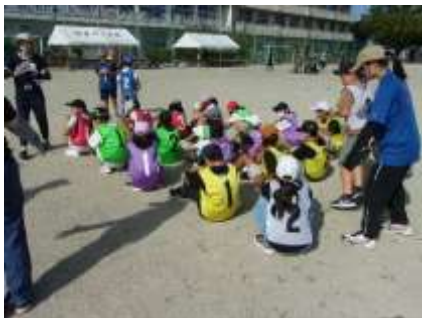
決勝係：実際に並んで練習です。