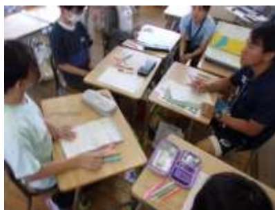
放送係：担当する競技を決めています。