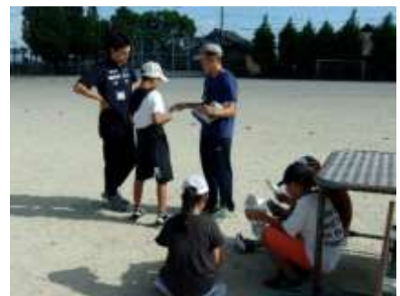
実行委員：開閉会式の練習です。