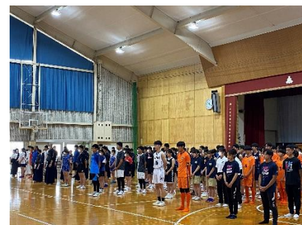
高校総体・夏の大会壮行式