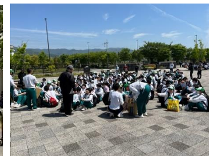
全校ウォーキング