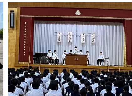
前期生徒会長選挙