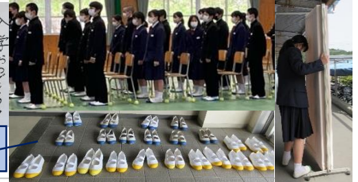
入学式練習、レクリエーション準備、自分のものと一緒に揃えてくれていた上靴