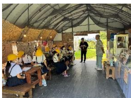
平川ブルーベリー園