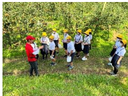
まるじゅんりんご園