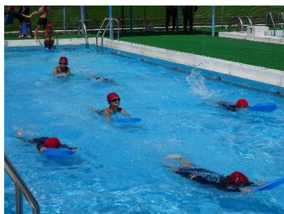
ビート板も上手にを使って泳ぐ2年生