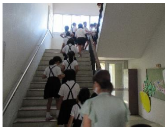
雷・大雨時の行動について学ぶ