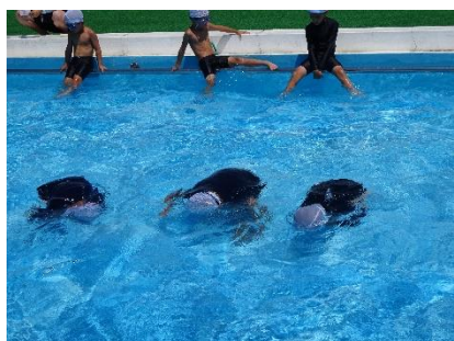
潜るのも上手になった1年生