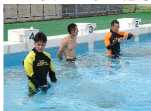
西消防署水難救助隊の皆様

5年生が、鳥栖・三養基地区西消防署の水難救助隊の方から、着衣水泳について学びました。服のままでは動きがとりにくいことを体感し、浮力を利用して水に浮く方法を教えていただきました。ペットボトルを握り、上向きで力を抜くと浮力で体が浮くことも実感できました。溺れたら無理に泳がず、空を見上げて浮くことの大切さを学んだ子供たち。水の事故に遭った時にどのような行動をとったらよいか、命を守る方法を教えていただきました。ご指導ありがとうございました。