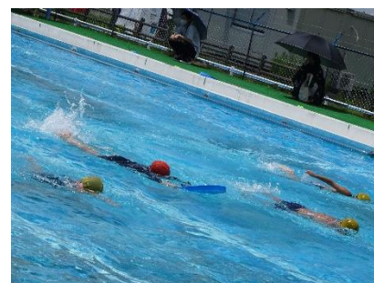
大プールで伸び伸び泳ぐ3年生

今年もコロナ感染症対策を取りながら、水泳の授業を行ってきました。その姿を授業参観という形で多くの保護者の方に参観していただくことができ、プールに子供たちの笑顔が広がりました。