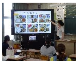
栄養教諭の給食についての話

これまでPTA行事の一環で取り組んできた1年生保護者対象の給食試食会でしたが、コロナ感染症対策を取り、どうにか実施することができました。最初に、栄養教諭から学校給食の目標や給食センターで作られている給食の内容、朝食の役割やアイデアなどについて話をさせていただき、その後、当日の給食を味わっていただきました。子供と一緒に会食はできませんでしたが学校給食の一端を感じていただくことができました。