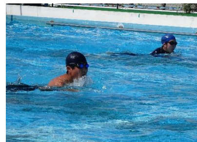
75メートルにも挑戦した6年生