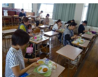
給食を試食される保護者