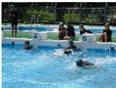
リレーにチャレンジする5年生