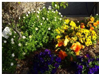
子供たちを待っていた花々

6日、始業式を迎え校内に子供たちの元気な声が戻ってきました。1つ上の学年となり、子供たちの顔にはやる気が満ちあふれています。一方、4月の定期異動で、下記のように新たに8名の職員を迎え入れました。転入してきた職員も、やる気いっぱい、赴任早々から意欲的に活動しています。