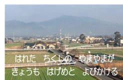
はれた ちくしの、やまやまが きょうも はげめと よびかける

2番は、「窓をひらけばさわやかに 晴れた筑紫の山々が 今日とはげめと呼びかける」とあります。北校舎3階の廊下から見えるこの風景は私のお気に入りの風景です。筑紫の山、三根の田畑、筑後川などの美しい自然から、私たちはいつも見守られている、元気をもらっているなど感じます。