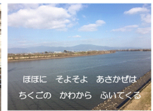
ほほに そよそよ あさかぜは ちくこの かわから 吹いてくる

2番は、「窓をひらけばさわやかに 晴れた筑紫の山々が 今日とはげめと呼びかける」とあります。北校舎3階の廊下から見えるこの風景は私のお気に入りの風景です。筑紫の山、三根の田畑、筑後川などの美しい自然から、私たちはいつも見守られている、元気をもらっているなど感じます。