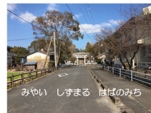
みやい しずまる はばのみち

1番は、「宮居しずまるばばのみち 頬にそよそよ朝風は 筑後の川から吹いてくる」とあります。筑後川からのさわやかな風がそよぐ学校へとつながる道に、元気いっぱいのお子様たちが通ってくる風景が浮かびます。