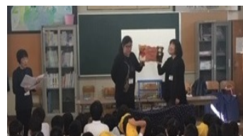
11月8日(金) 昼休み、読み聞かせボランティアの方々のご協力のもと行った「お話し会」の様子です。毎回子どもたちには好評です。

読書習慣の形成や言語能力の育成は、小学校段階では特に大切だと考えます。家庭での少しの時間を読書に当ててみてはいかがでしょうか。夕食後や就寝前などの15分程度の読書も効果的だといわれていますよ。