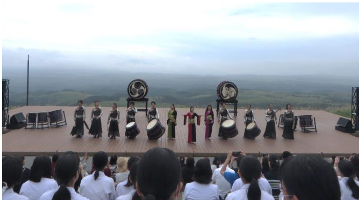
奇跡的に晴れた野外ステージで、素晴らしいTAOの演奏