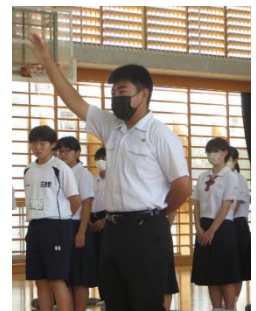
—選手推戴式— 選手代表による 力強い選手宣誓 (野球部主将)