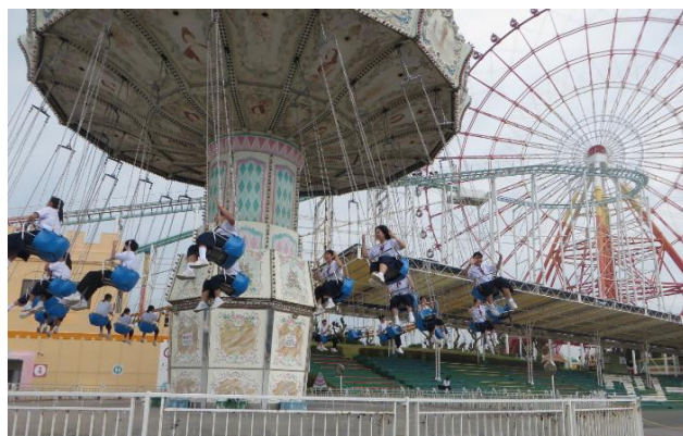
3日目のグリーンランドはとにかく楽しみました！

熊本の地ならではの環境と人、自然、芸術に触れた有意義な旅でした。そして、3年生の絆がぐっと深まった楽しい3日間となりました。