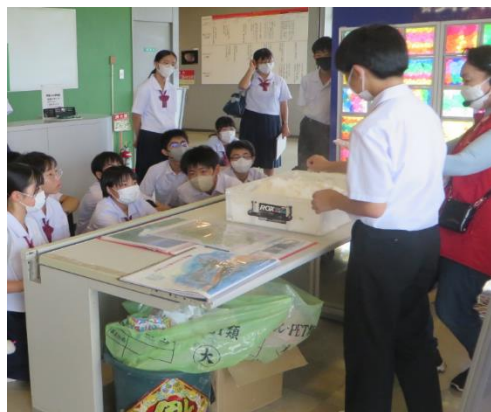
阿蘇火山博物館でのカルデラ実験の様子