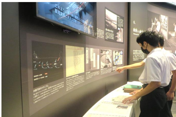
水俣病資料館で真剣に水俣病に向き合いました。

1日目の水俣病資料館では、展示されているさまざまな記録や写真、映像を真剣に見て、熱心にメモをとっていました。