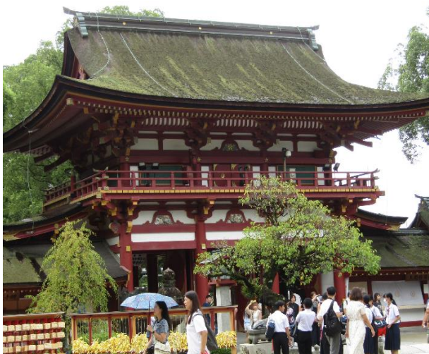
歴史のある太宰府天満宮にて班別自主研修

グループ別の自主研修は、3年生での修学旅行で行う班別自主研修の予行練習でもあります。「たかが1日、されど1日」。2年生は、自主研修の中で、予想外のことに臨機応変に対応することを学んだと思います。