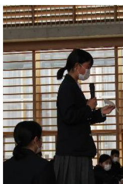
よりよい活動を目指して発言

三根中生徒会のスローガンは、「誠心誠意！自律心溢れる三根中学校 ～みんなで語り合い未来を創る生徒会～」です。このスローガンのもと、生徒会長があいさつで述べてくれたように、J S N (自己指導能力) を合言葉に、新型コロナウイルスの中でも、できることに精一杯取り組んでほしいと思います。