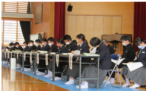
三根中生徒会をけん引する生徒会役員

生徒総会を行う前に、まずは、4月22日に各学級で検討をして臨み、その検討をもとに、総会当日は、「質問」や「新たな提案」がなされました。発言者と生徒会役員とのやり取りには、