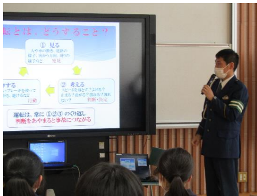
交通課指導係の方からの講話の様子

交通安全は、大人にとっても重要です。ぜひ、ご家庭でも話題にさせていただきたいと思えます。