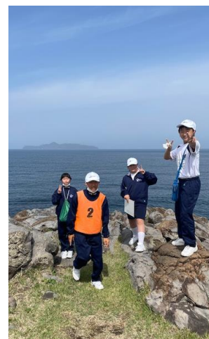
海を背景に、最高の笑顔！

学校に戻ってきた1年生の様子からは、少し疲れ気味でしたが事故や病気もなく、3つの目標をクリアして宿泊訓練が充実した2日間であったことが分かりました。異なる小学校出身の友達とも、少し距離が縮まった楽しい2日間だったようです。