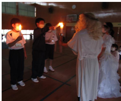
キャンドルの集い