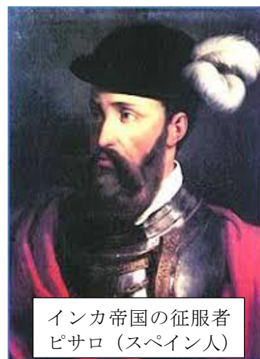
インカ帝国の征服者 ピサロ（スペイン人）

これはなぜでしょうか？アジアやヨーロッパでは広く流行していた病気が、アメリカ大陸には存在していなかった。この理由は何でしょうか？（次号に続けよ。）