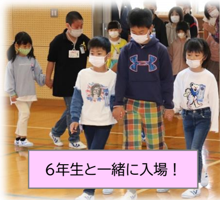
6年生と一緒に入場!