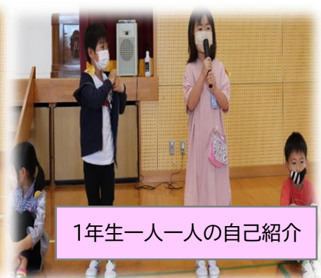
1年生一人一人の自己紹介