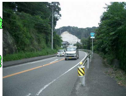
☆8 【広坂カーブ】 見通しが悪く高速車も多いため国道横断はようちゅうい!