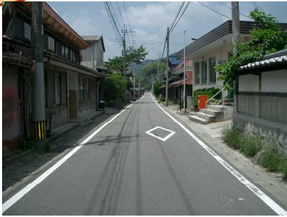
☆1 【郵便局前】 道はぼがせまく、車が多い!