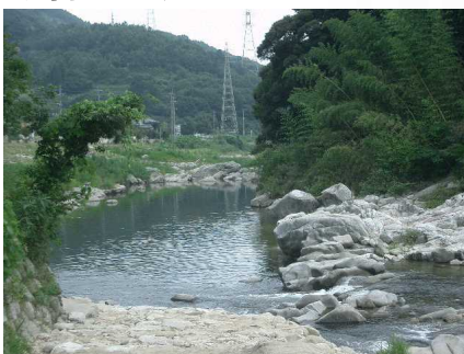
☆11 【そよ風館うらのかせ川】 河原に降りることができる。深みや滝があり流れもはやい。雨の後は水量注意。