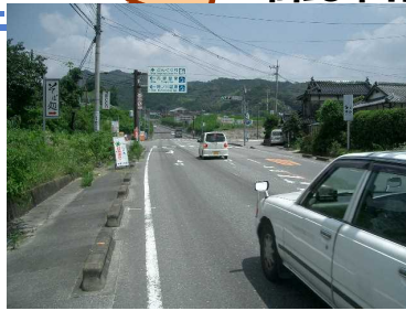
☆2 【三反田交差点】 県外ナンバーも多く、スピードを出す車が多い。