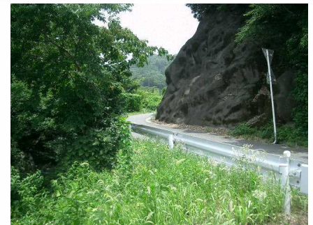
☆9 【有の木町道】 せまく、急さかでカーブ多し。国道にでるさいようちゅうい!