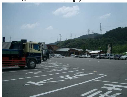
☆12 【そよ風館駐車場】 平日でも大型バス、観光客が多く、せしよく事故多い。