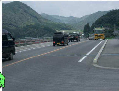
☆4 【新橋】 直線道路で交通量多い。歩道に縁石がなく、あぶない!