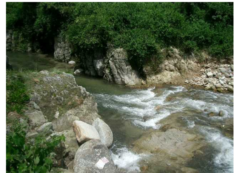
☆3 【梅野橋下】 川にすぐにおりることができる。水が冷たく、場所により流れが急であぶない。