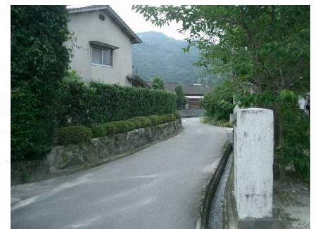
☆6 【井手の原地区ない町道】 道がせまく歩道もない。カーブが多くて、見通しが悪い。自転車はとくにちゅうい!