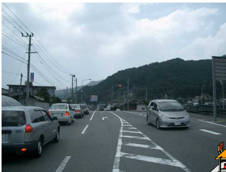
☆7 【昭和橋三差路】 県外ナンバー多く、方向指示器無点滅で曲がる車多い