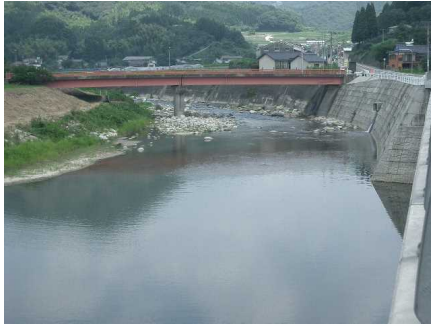
☆5 【新橋下のかせ川】 浅瀬で流れがおそく、水遊びがおおい。深みが所々にあってあぶない!