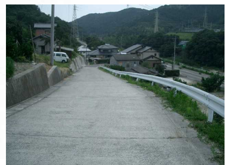
☆13 【広坂の急さか】 急な坂で、交通量の多い国道にぶつかる。自転車でおりるさいは、ちゅういがひつよう!