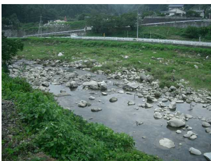
☆10 【広坂西かせ川】 石の足場があり、ついや川遊びが見られる。道沿いは、車窓からみえず死角になり、あぶない!