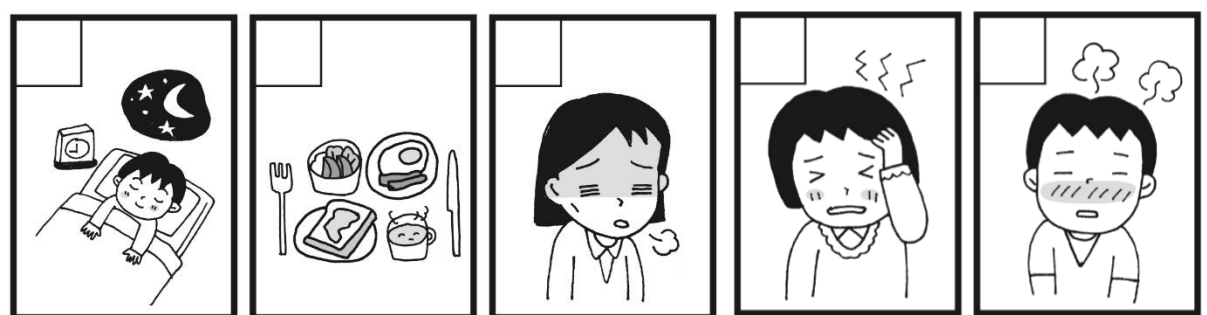
【チェック①】 前の日はよくねむれましたか? 【チェック②】 朝ごはんをしっかり食べましたか? 【チェック③】 体のだるさはありませんか? 【チェック④】 頭のいたみはありませんか? 【チェック⑤】 熱っぽい感じはありませんか?