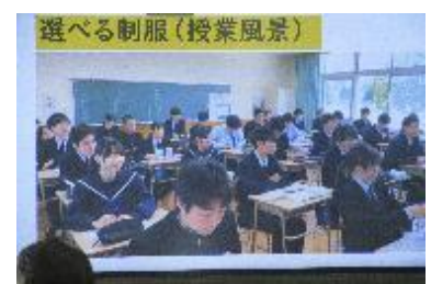
東高「選べる制服、詰襟とセーラー」