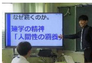
清和「人間性の涵養」