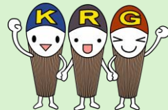
厳木高校 マスコットキャラクター わかすぎくん

今年度は、学校行事とあわせた5月10日(土)に 第2回目のイベントを開催することになりました!