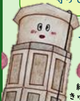
給水塔 きゅー太郎