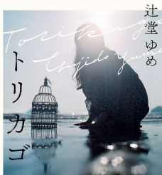
トリカゴ 著・辻堂ゆめ