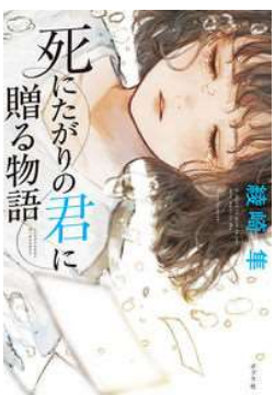
死にたがりの君に贈る物語 著・綾崎隼

夜明けのすべて 著・瀬尾まいこ 月に一度のPMS（月経前症候群）でイライラが抑えられない藤沢さんとパニック障害で苦悩する山添君。二人が働くのは栗田金属という零細企業。二人は理解ある社長とベテラン社員に支えられ、お互いをおもいやる関係になっていく。