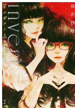
Invert 城塚翡翠倒叙集 著・相沢沙呼