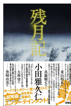
残月記 著・小田雅久仁