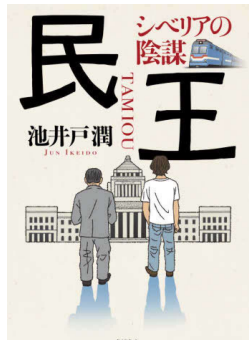
著・池井戸潤 分類 913.6 ページ数 317