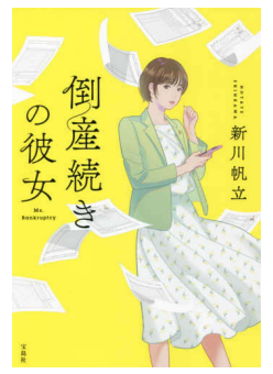
著・新川帆立+ 分類 913.6 ページ数 321

今年度購入した中で、司書おすすめの本を紹介させていただきます。 「スモールワールズ」著・一穂ミチ ままならない現実を抱えながら生きる人たちの6つの物語。特に2話目の「魔王の帰還」は、読書が苦手な方でもおもしろく読めると思いますよ。