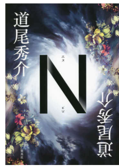
著・道尾秀介 分類 913.6 ページ数 359