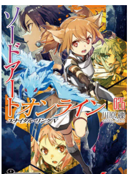
著・川原礫 分類・913.6 最新の26巻

旅する練習 著・乗代雄介 中学入学を前にしたサッカー少女「亜美」と小説家の叔父との徒歩の旅。ユーモアたっぷりの姪との二人で始まった徒歩の旅だが、途中偶然出会った女子大学生との三人旅へ。最後の結末をどう思うかは「読者」しだい。