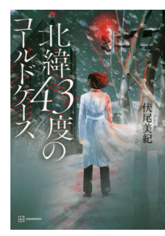
著・伏尾美紀 分類 913.6 ページ数 384