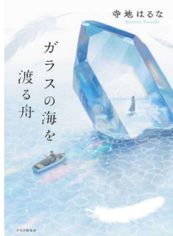
著・寺地はるな 分類・913.6 ページ数 245