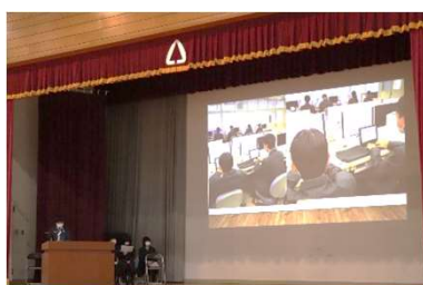
2年総合的な探究の時間