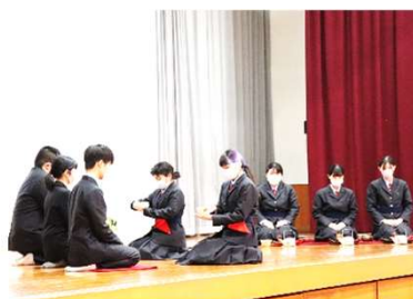
茶道部・御点前披露