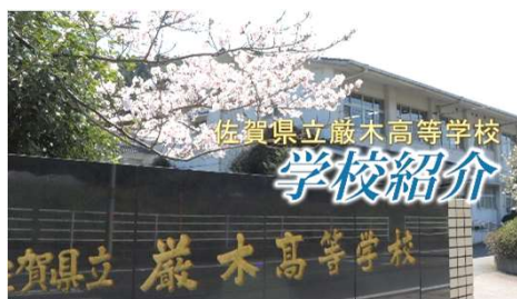
放送部・学校紹介ビデオ