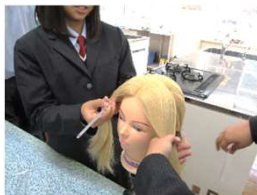
「美容・メイク」講座

スポーツではテーピングの実習もあり、講師の先生の指示に従い、作業を体験していました。