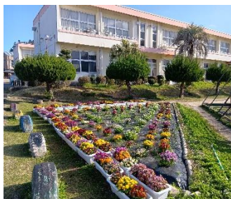
花いっぱい三角花壇

春休みも無事に終わり、3週間ぶりに子供たちの元気な声が、学校に帰ってきました。4月7日（月）新しく4人の先生を迎える「赴任式」で始まりました。初めて対面した子供たちの目は、食い入るように私たちを見つめ、きらきら輝いていました。新しい学年、新しい教室、新しい先生。新鮮な気持ちでスタートを切り、これから、精一杯の頑張りをを見せてくれると思います。