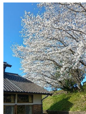
新校舎と満開の桜