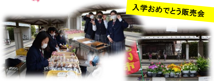
入学おめでとう販売会