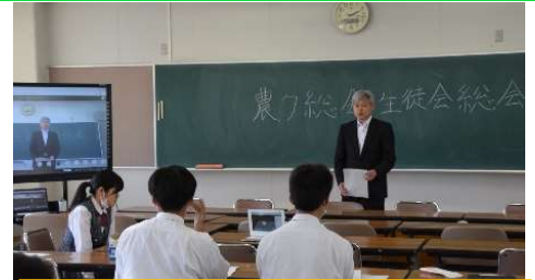
農業クラブ総会・生徒総会

新型コロナウイルス感染拡大防止の観点から、全校生徒が一堂に会することのないようにしています。その中で活躍しているのが、インターネットを活用したコミュニケーションツールMicrosoft Teamsです。生徒総会や農業クラブ総会、特別支援教育講演会、SAGA2020 SSP杯の壮行会などでは、特別教室や体育館の発表映像や音声を、各教室の電子黒板を利用して視聴しました。総会で発表した生徒は「慣れない感じだけど、大勢の前に立つより緊張しなくてよかった。」と感想を話していました。各教室の生徒たちからは「音声と映像のずれもほとんどなく、聞き取りやすかった」という声が聞かれました。今後も機会あるごとに活用していきたいと思えます。