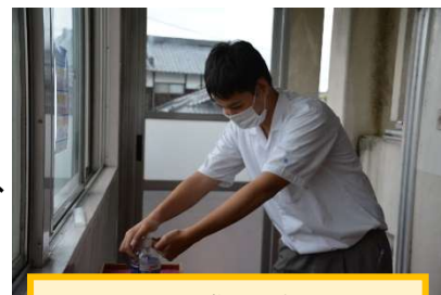
みんなで感染拡大防止

日々の学校生活の中では、全職員・生徒の毎日の健康観察、マスクの着用、こまめな換気、職員によるドアノブ等の消毒などを行っています。教室等の各階に設置したアルコールでは、登校時や休み時間等に消毒している生徒の姿をよく見かけます。授業や特課、集会では、大人数を集めない、広い場所を使うなどできる限り「密」にならないようにしています。