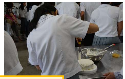
昨年度の体験入学の様子