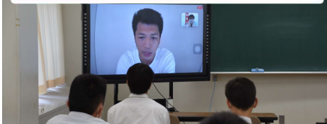
ボクシング部オンライン授業