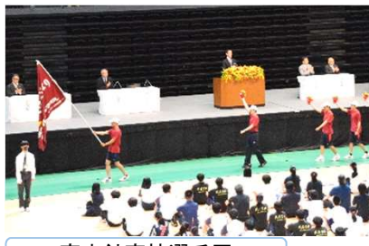
高志館高校選手団