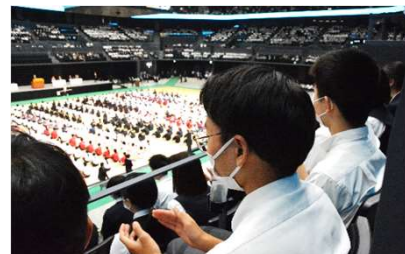
観客席で拍手を送る生徒たち