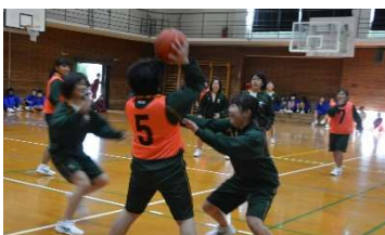
バスケットボール優勝 男: 環境緑地科3年 女: 食品流通科3年

12月23日(月)2学期のクラスマッチを行いました。各クラスの生徒がサッカーとバスケットボールに分かれ、熱戦を繰り広げました。1、2年生も協力してがんばりましたが、多くの競技では3年生が優勝し、有終の美を飾りました。