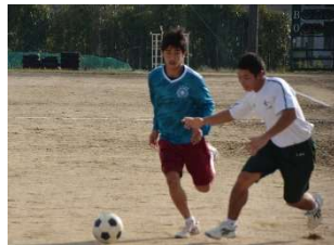
サッカー優勝 男: 環境緑地科3年 女: 食品流通科2年