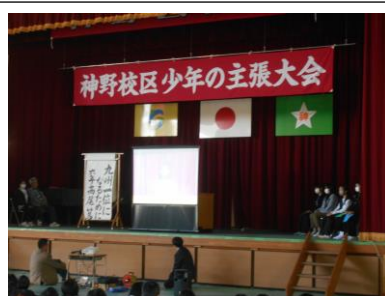
「少年の主張大会」には5、6年生の各学級代表1名がステージでしっかり主張しました。2週間ほど前から昼休みをつぶして練習を頑張っていました。本番もバッチリ、すてきな主張でした。