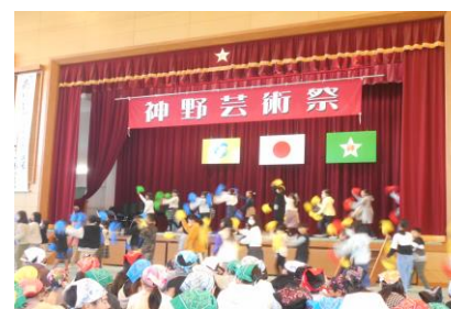
「神野芸術祭」には4、5、6年生が参加しました。4年生はダンス。5年生はキッズマートの宣伝。6年生はそうらんを披露しました。また、成草中の吹奏楽の演奏や、プロの演奏家によるピアノ、バイオリン、フルートの演奏に酔いしれました。