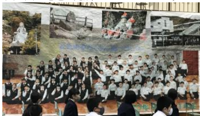
1年 モザイクアート