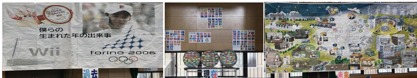
2年 モザイクアート「過去」「現在」「未来」