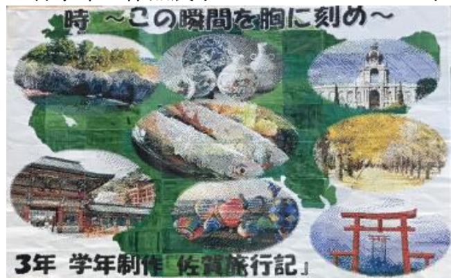
3年 モザイクアート