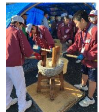
うまかつけたかな？