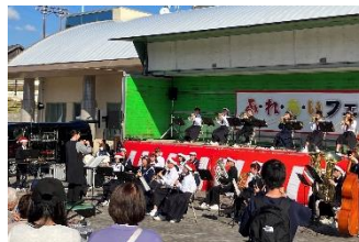
屋外での演奏でした

吹奏楽部の演奏は、普段と違って屋外でしたが(暑かったですね！)多くの方に聴いて頂きましたね。各ブースでのボランティアもさることながら、吹奏楽部の演奏の時に、椅子や譜面台を並べるのを手伝ってくれた3年生の生徒の皆さんがいたそうです。これも立派な「ボランティア」ですね。短い時間で準備しなければならなかったのととてもとても助かったとのことでした。これからも困っている人を見かけたら積極的にお手伝いして下さい！