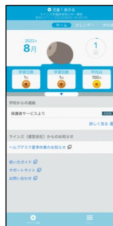
▲保護者アプリ ホーム画面