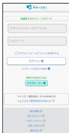
▲保護者アプリ ログイン画面

上記2で新規登録後、登録したメールアドレスとパスワードを入力し、「ログイン」を選ぶと、ホーム画面が表示されます。