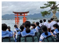
改修後の宮島の大鳥居