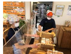
丁寧にっつ・・・