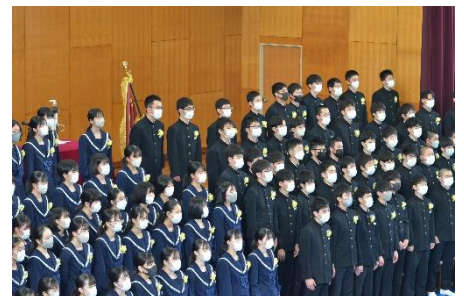
3年生学年合唱「さくら」