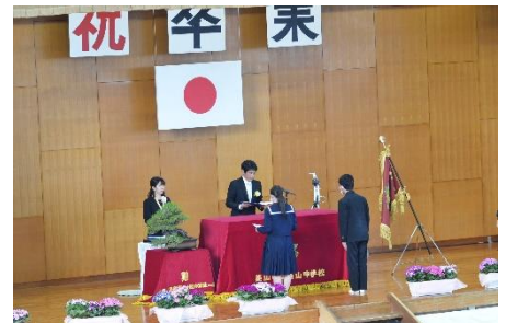
卒業証書授与の様子

全学年が参加しての卒業式は3年ぶり、実際に体育館での卒業式を経験した生徒はほぼいないため、どのような式になるかを心配していましたが、まさに杞憂でした。1, 2年生が、今回の卒業式を基山中学校の伝統として受け継いでいってくれと嬉しいです。来年の卒業式も素晴らしいものにしましょう!(ちょっと気が早いですがね?)