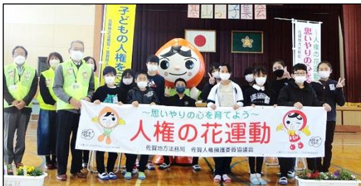
【代表で参加した園芸委員の子供たちと記念撮影】

「おむすびころりん」の暗唱がんばりました。運動会では、きつね、今度はねずみに変身！ねずみのダンスも決まっています。上の写真の人間おむすび？もナイスアイデア！