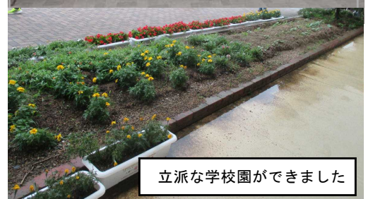
立派な学校園ができました