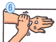
手首も忘れずに洗います。