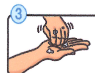
指先・爪の間を念入りにこすります。