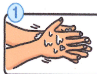
流水でよく手をぬらした後、石けんをつけ、手のひらをよくこすります。