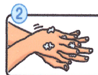
手の甲をのぼすようにこすります。