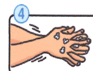
指の間を洗います。