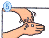
親指と手のひらををり洗います。