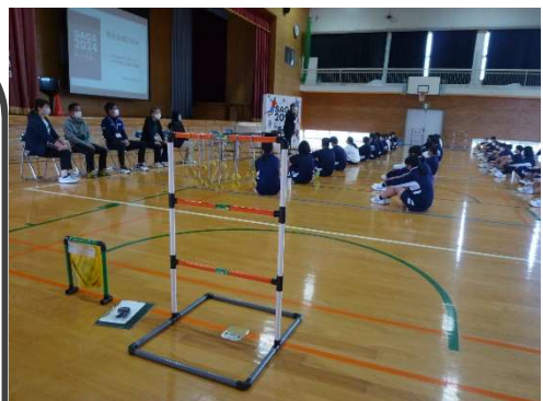
[5/10 国スポなど学校訪問の一場面]