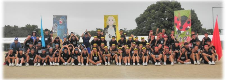
[9月11日 体育大会の一場面・戦い終わって…]