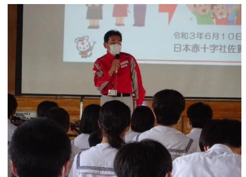
[6月10日 JRC 結団式 新型コロナに関する話]