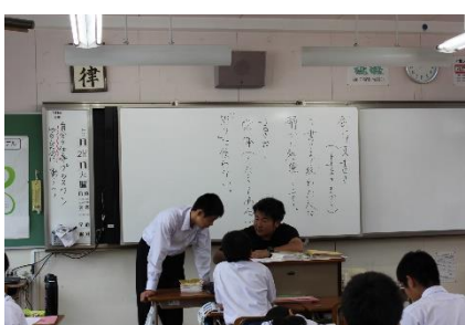
【2年国語 助言を得て創作】