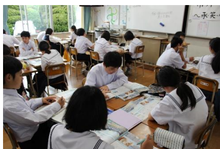
【1年社会 学び合う学習】