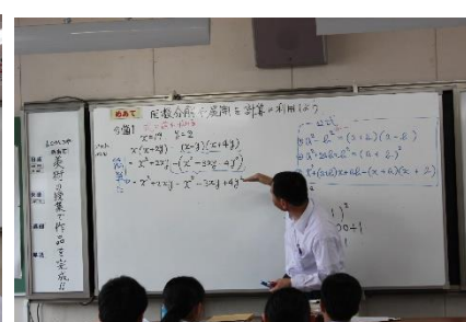
【3年数学 明確なめあてのもと】