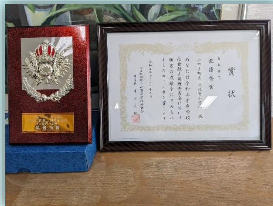
佐賀県学校給食献立調理発表会で最優秀賞