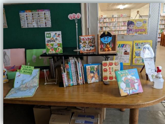
図書室前のウェルカムコーナー

3学期は、ご家庭でも読書に親しむ時間を設けていただくとうれしいです。私も、たくさんの本を読んでいこうと思います。