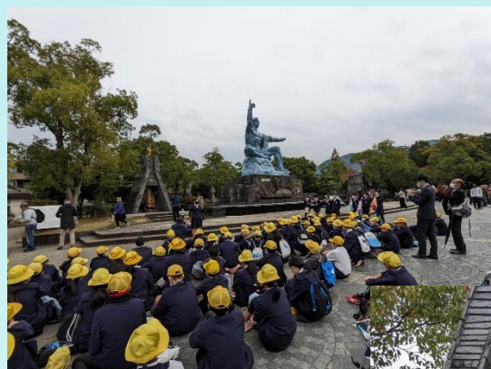
平和集会の様子です。

それぞれの学年でも、修学旅行で学んだことが、これからの生活に生かせることを願っています。