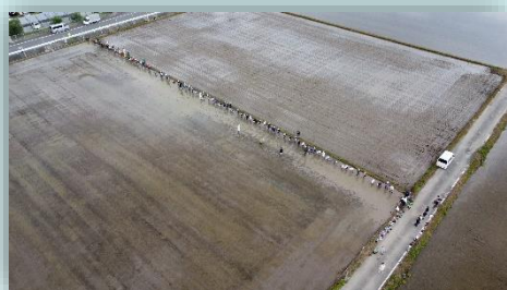
写真の真ん中。一列に並んでいます。

6月23日（金）に、5年生の田植え体験学習がありました。今年も、防災センター南側に学習田をお借りして、JA青年部や関係者の方のご指導のもと学習することができました。子どもたちは、紐に等間隔に付けられた目印通りに、しっかりと植えることができました。梅雨の晴れ間の中、楽しそうに苗を植えている子どもたちの姿が印象的でした。ご協力いただいた皆様、ありがとうございました。