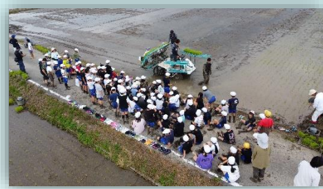
残りの部分は機械で植えていただきました。