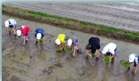
目印に合わせて、植えています。