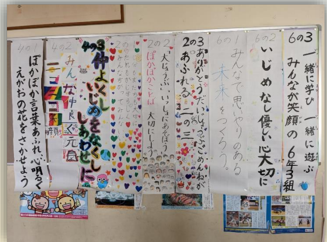
各クラスで考えた人権標語を、学年で使っている昇降口に掲示しています。