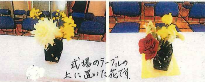
式場のテーブルの上に置いた花です。