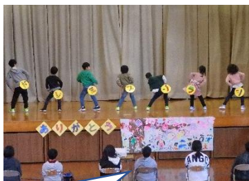
「ドレミの歌」のダンス。とってもかわいかったです。

3月2日（木）に6年生を送る会を行いました。少し時間は超過してしまいましたが、心のこもった、とっても温かい会になりました。どの学年からも「ありがとう」の言葉がたくさん聞かれ、6年生を楽しませるための出し物もよく考えられていて、それぞれの学年の個性が出ていました。また、それを受けて、6年生からの出し物もありました。1年生から5年生まで、それぞれの学年のよいところを伝える劇でした。また、全ての先生一人一人に「ありがとう」のメッセージを送ってくれました。とても感動しました。私たち職員も、6年生のために、「明日があるさ」を演奏し、曲のプレゼントをしました。