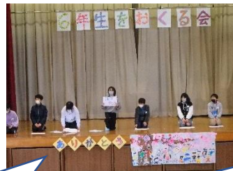
先生一人一人、具体的な言葉で「ありがとう」を伝えました。