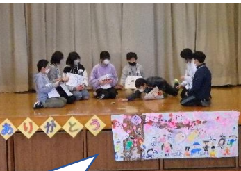
笑いを交えた劇で各学年のよいところを伝えていました。