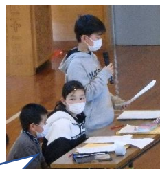
運営委員会、新メンバーでの司会。先生の力を借りずに立派にやり遂げました。