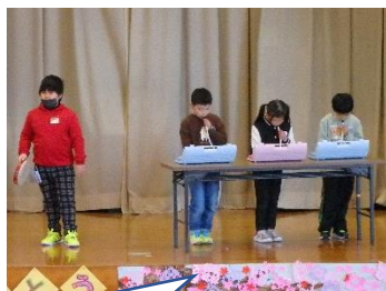
「カッコウ」の演奏。よくそろっていました。