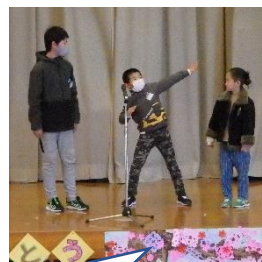
6年生を巻き込んだコント。大爆笑でした。