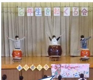
和太鼓の音が心に響きました。