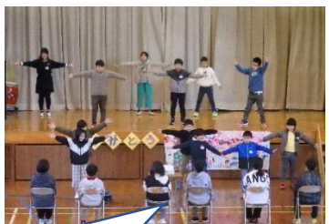
「虹」の合唱とダンス。司会から「きれっきれのダンス」と褒められていました。