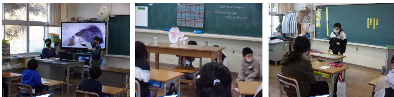
国語で学んだ「動物の赤ちゃん」を基に話しました。

はきはきタイムのまとめとして、学年間交流をして発表をしています。1年間のまとめとして、しっかり話すことができます。話し方も上手になりましたが、聞き方も上手になり、感想なども自分の言葉で言うことができます。