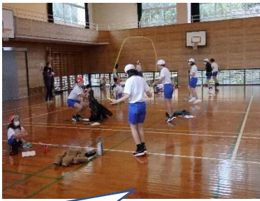
応援のお陰で記録が伸びた子供がたくさんいました。