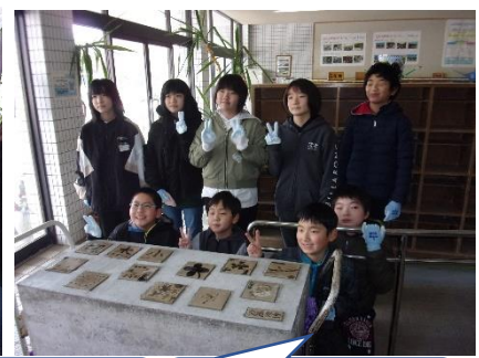
完成後の記念撮影。みんな満足気な笑顔