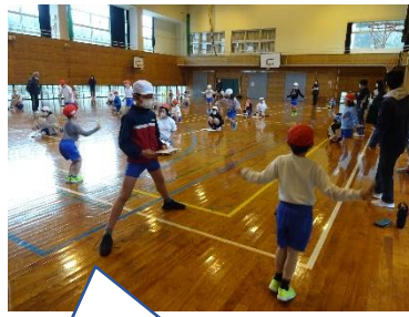
6年生は1年生の回数を数えて記録をしてあげます。