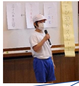
進行は全て子供たち。跳んだり、会を運営したり…よく頑張っていました。