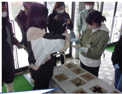
協力して陶板に接着剤を付けました。私も「交通安全」の陶板を子供たちに教えてもらいながら貼りました。