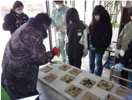
はじめにお手本を見せられました。

コンクリート作りから頑張っている、卒業制作の花壇作りがいよいよ仕上げに入りました。岸岳窯三帰庵で焼いていただいた陶板を、花壇にはめ込む工程に進みました。1月23日！なんとこの日は大寒波により、吹雪！テントを張って外で作業という案もありましたが、玄関に花壇を運んでくださり、屋内で作業をしました。