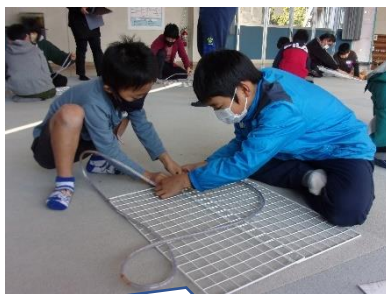
6年生に手伝ってもらっている1年生。頼りになるお兄さんお姉さんです。