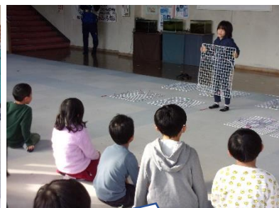
1人ずつ自分の作品の紹介をしました。