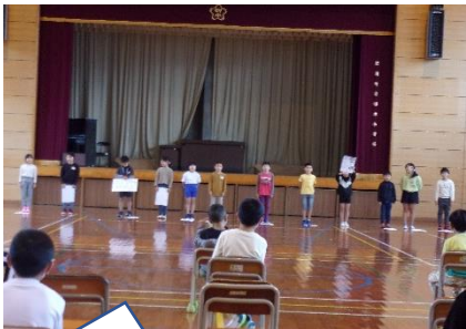
全員が感想を伝えることができました。まっすぐに手を挙げる姿も素晴らしいものでした。

毎週金曜日は「はきはきタイム」として、子供たちの表現力や言葉で伝える力を高める活動を行っています。各学級で、発達の段階や児童の実態に合わせて行っているため子供たちは自分のクラス以外の活動内容を知りません。そこで、「はきはき集会」を行い、各学年の取組を知ったり、多くの人前で発表する体験をさせたりしたいと思い計画しました。