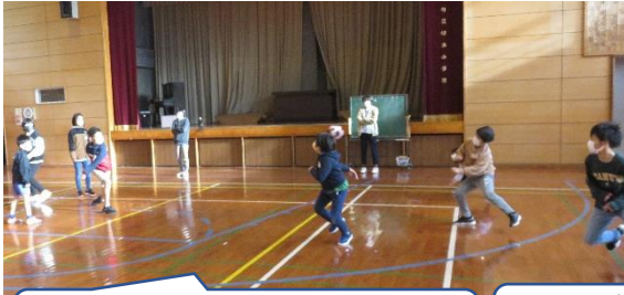
この日は雨だったので、班対抗でドッジボールをしました。