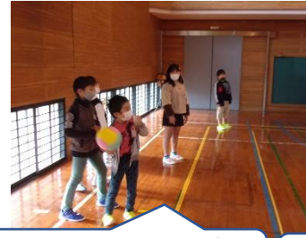
取ったボールを1年生に投げさせてあげていました。