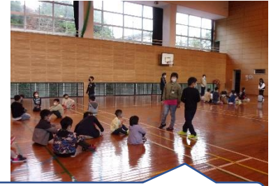
活動の後には、必ず振り返りをします。